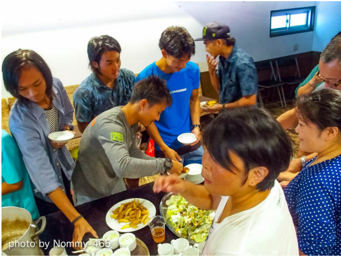
レースのあとのホッとする楽しいひととき。